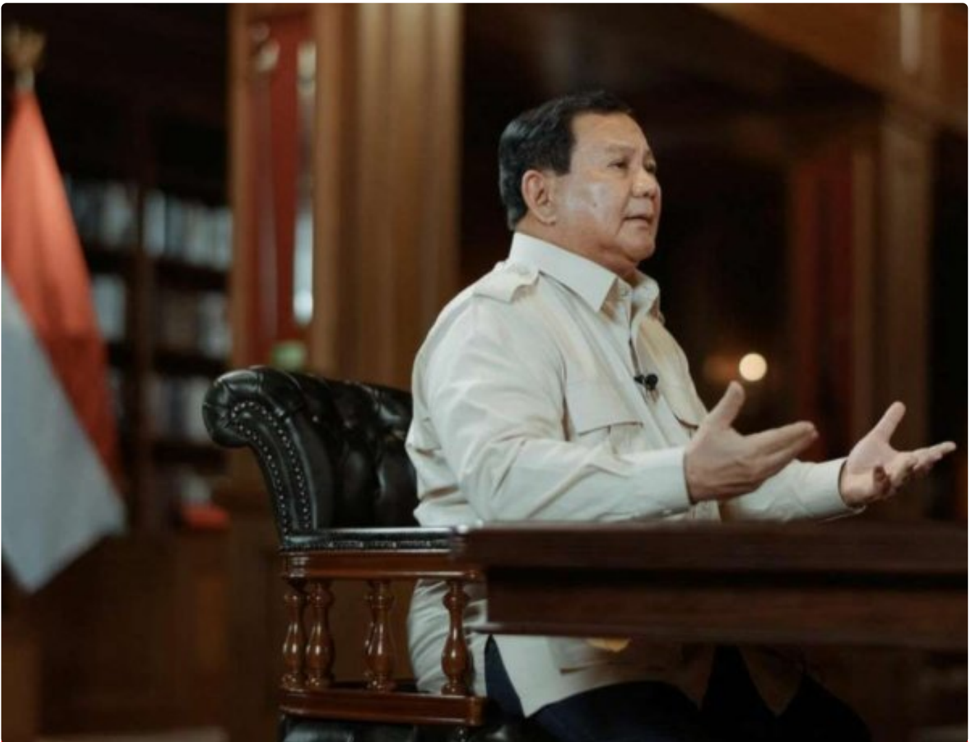
Prabowo Subianto Presiden RI 2024-2029

PENDIDIKAN - Indonesia dikenal sebagai negara yang kaya akan sumber daya alam. Dari hasil tambang yang berlimpah, laut yang luas dengan kekayaan hayati yang melimpah, hutan yang menjadi paru-paru dunia, hingga sumber daya energi yang tersebar di berbagai wilayah, semuanya menjadi kekuatan besar bagi bangsa ini. Potensi besar tersebut seharusnya dapat dimanfaatkan untuk